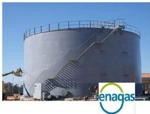
TANQUE DE ALMACENAMIENTO DE AGUA ( \emptyset 20.5 x 9.5 Mts) I.A GAS YELA- GUADALAJARA.