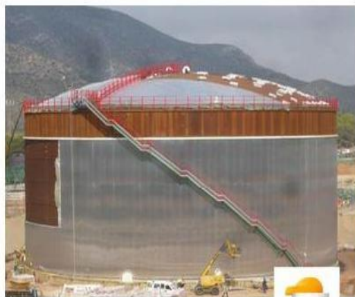
TANQUE DE ALMACENAMIENTO RESIDUO DE VACIO ( \emptyset 46 x 20 Mts- 33238 M 3 ), localidad de Cartagena España