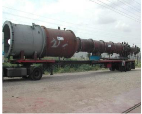
COLUMNA CEPSA - REFINERIA HUELVA