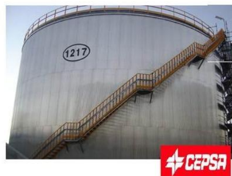
TANQUE DE ALMACENAMIENTO DE GAS OIL ( \emptyset 24 x 12 Mts) REFINERIA ALGECIRAS.

COMUNICAMOS A NUESTROS CLIENTES QUE ESTOS SON ALGUNOS DE LOS MUCHOS PROYECTOS EN LA CUAL NOSOTROS HEMOS TRABAJADO (VER MAS REFERENCIAS EN ANEXOS)