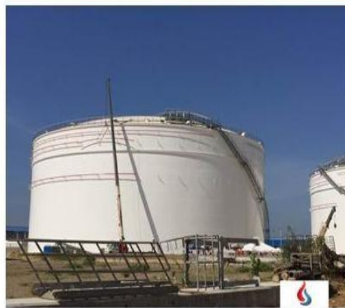
TANQUE DE ALMACENAMIENTO DE CRUDO ( \emptyset 55.47 x 21.94 Mts) CON VOLUMEN DE 330.000 bls c/u, ubicada en Cartagena Colombia